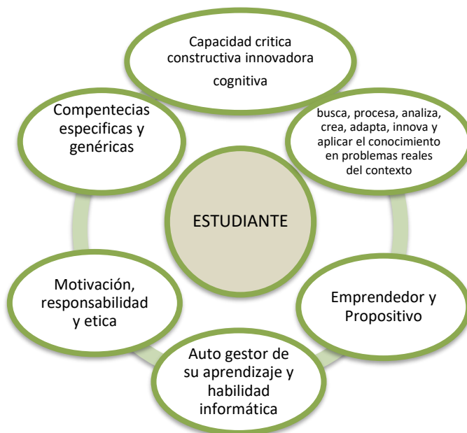
Figura 2: Rol del estudiante

Nota: La Figura, representa el rol del estudiante en la modalidad a distancia