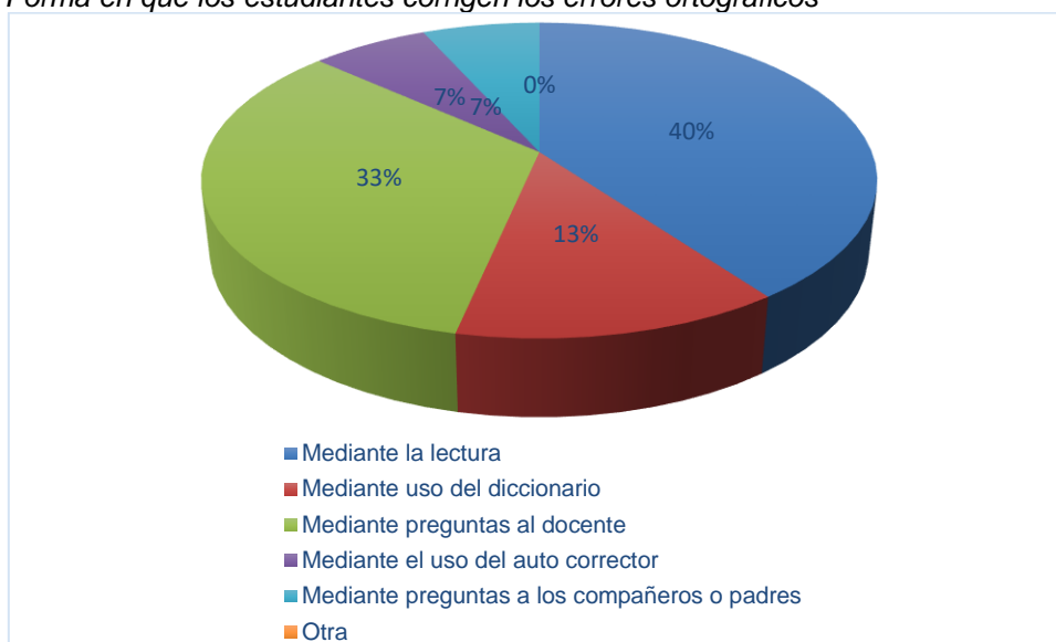
Figura 3 Forma en que los estudiantes corrigen los errores ortográficos

Nota: Los estudiantes corrigen los errores ortográficos mediante la lectura.